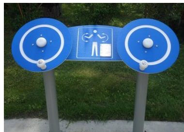
einige Stationen des Bewegungsparcours