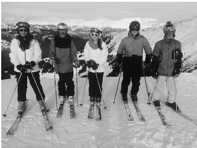
Im Hintergrund die Ringelspitze (3'247 m.ü.M.)

Valbella ("Schönes Tal") liegt auf einer Höhe von rund 1'500 Metern zwischen der Lenzerheide (Planoiras) im Süden und der Gemeinde Parpan im Norden. Im Süden grenzt der Ort an den Heidsee. Im Norden bildet der Lenzerheidepass (1'549 m.ü.M) den Ortsrand und den Übergang ins Churwaldnertal. Im Westen Valbellas liegt das Stätzerhorn, im Osten das Parpaner Weisshorn.