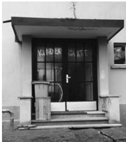
Der Eingang zum Kindergarten Bahnhofstrasse 16, wie er nicht mehr lange zu sehen sein wird.

Um das Vorhaben zu verwirklichen, waren auch intern diverse Rochaden nötig: Klassenzimmerwechsel im Schulhaus Kleinfeld Ost, Turnhallenwechsel der Sechstklässler in die Sporthalle, Stundenplanänderungen für den musikalischen Grundkurs sowie zusätzliche Busfahrten für die jüngeren Kinder, welche auch nach dem Umzug im Schulhaus Bahnhofstrasse in Deutsch als Zweitsprache unterrichtet werden. Eine hohe Flexibilität innerhalb der Lehrerschaft sowie eine breite Hilfsbereitschaft und Unterstützung unserer Hauswarte ermöglichten in Zusammenarbeit mit dem Schulrat eine gute Planung und Umsetzung.