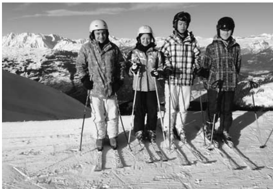
Im Rücken die imposante Surselva