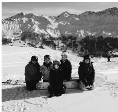
Blick in Richtung Arosa