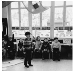
Unterricht im Kindergarten Bahnhofstrasse 16

Für die Kinder und die Eltern war der Umzug mit einigen Umstellungen verbunden: Ein neuer Kindergartenweg, ein neuer Kindergarten in einem grossen Schulhaus, ein neuer Pausenplatz, eine andere Turnhalle und sicher Vieles mehr. Die jüngeren Kinder dieser Klasse können aufgrund ihrer Wohnlage den neuen Weg gut zu Fuss bewältigen. Für einige ältere Kinder, welche im Quartier Seestrasse wohnen, fährt der Schulbus zusätzlich.