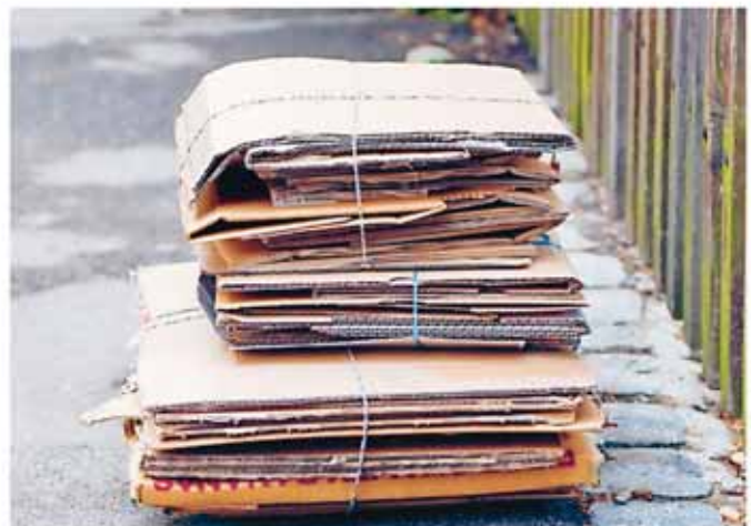
Falten, bündeln, schnüren – fertig!

Nur so können Sie sicher sein, dass Ihr Karton nicht auf der Strasse oder bei den Nachbarn im Garten landet.