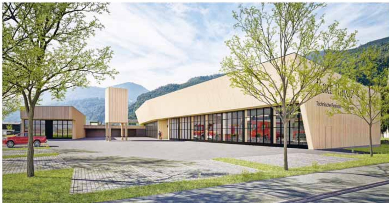
Visualisierung: Blick auf den Vorplatz beim neuen Feuerwehr- und Werkhofgebäude