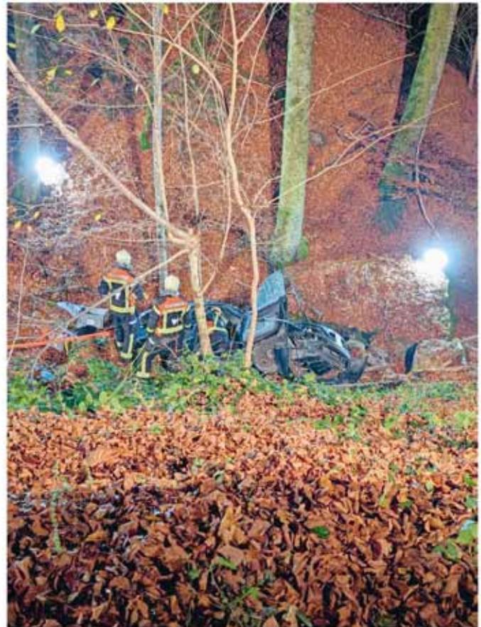
Eindrücke von der diesjährigen Hauptübung der Feuerwehr Bad Ragaz