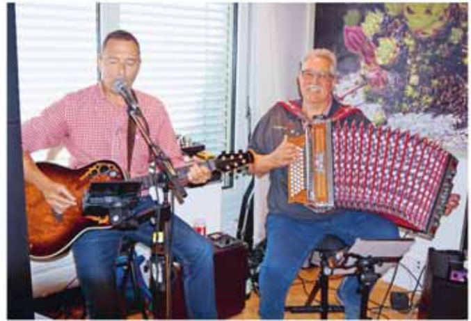
Das Duo «Hoggläder» sorgte für eine grossartige Atmosphäre.