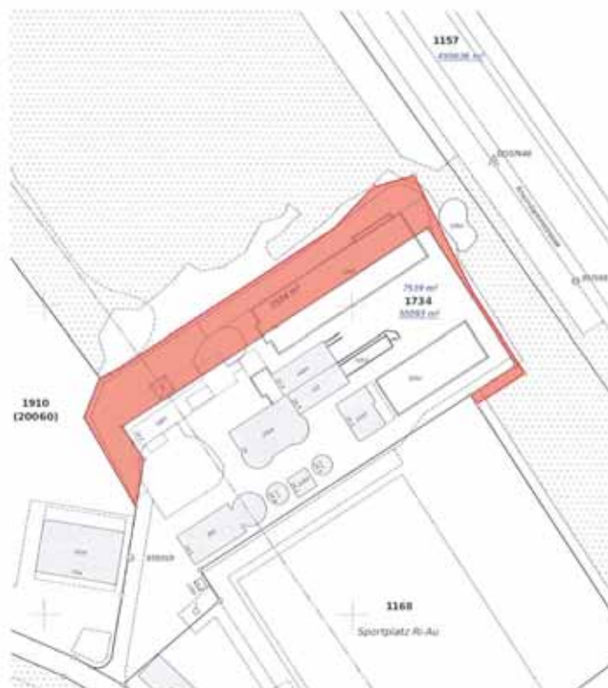
Geometermutationsplan Kreis AG Sargans