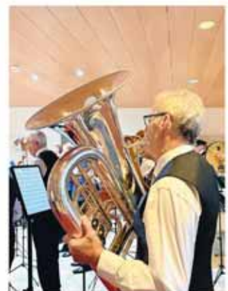
Mit grosser Freude wurde die Musikgesellschaft Harmonie im Altersheim Allmend begrüsst.