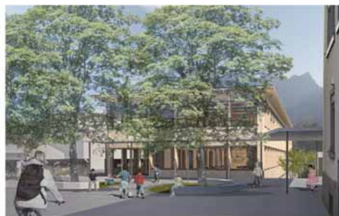
Blick vom Pausenplatz zum sich im Bau befindenden Schulhaus Sarganserstrasse 6a (Visualisierung: GREDIG WALSER)

Am 18. September 2025 erteilte der Gemeinderat folgenden Auftrag im Einladungsverfahren: