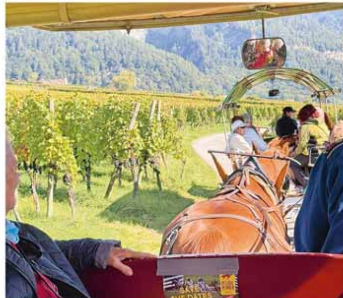
Kutschenfahrt mit der «Rössli-post» durch die Bündner Herrschaft