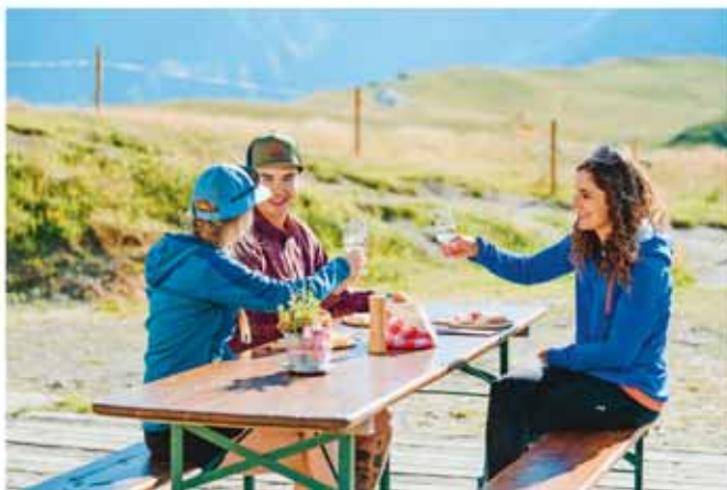
Die Kulinarikwanderung verbindet Bewegung und kulinarischen Genuss.