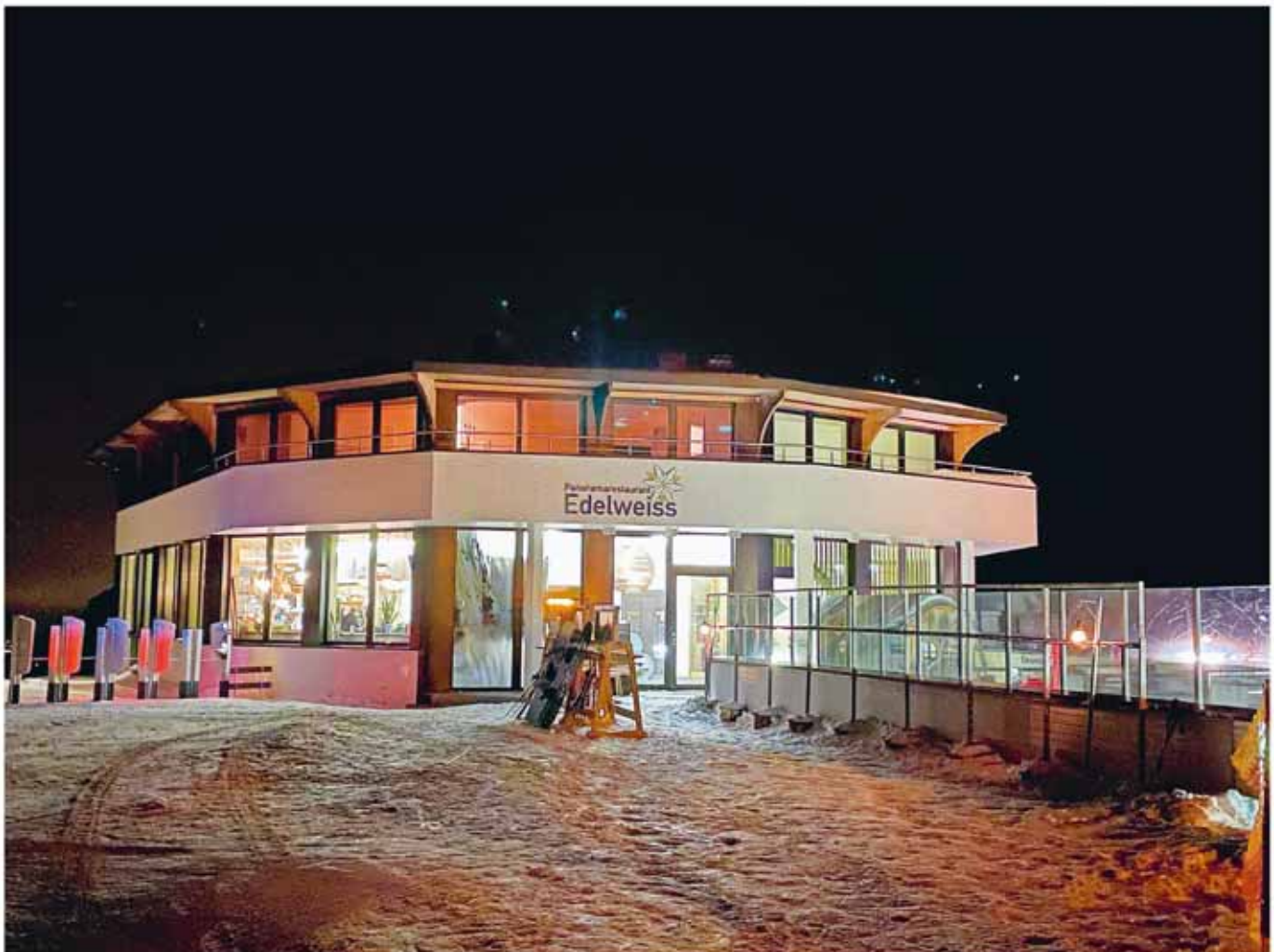
Das Panoramarestaurant Edelweiss verwöhnt die Gäste bei den Samstagabendfahrten mit einem speziellen kulinarischen Angebot.