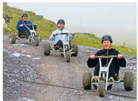
Eindrücke vom Personalausflug auf den Pizol