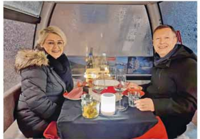
Genießen Sie ein vorzügliches Käsefondue in der «Fonduegondel».

Mit dem Apéro an der Talstation der Gondelbahn startet eine faszinierende Fahrt über das beleuchtete Rheintal. Die Beschenkten genießen in einzigartiger Atmosphäre ein vorzügliches Käsefondue in den schwebenden Gondeln und lassen den Abend bei Kaffee und Dessert auf Pardiell ausklingen.