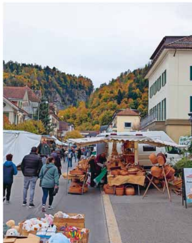
Der traditionelle Herbstmarkt bot für die Besucherinnen und Besucher einmal mehr Gelegenheit, sich zu begegnen, lokale Produkte zu entdecken und die herbstliche Stimmung zu geniessen.