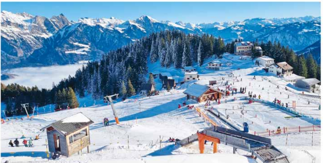
Start in die Wintersaison im Skigebiet Pizol