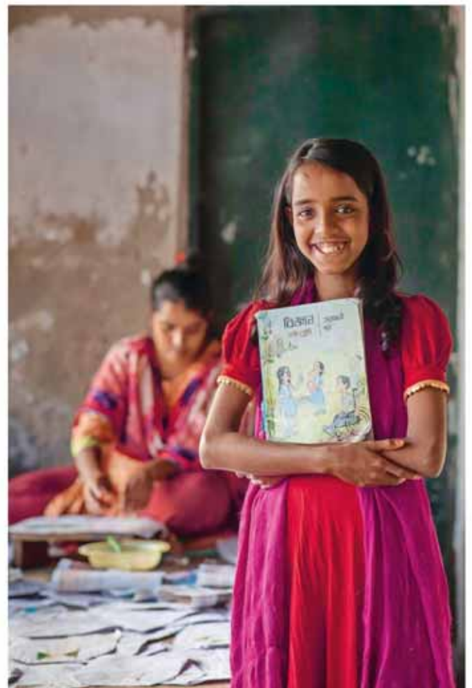
Foto: Nour freut sich auf den Unterricht. © Kindermissionswerk «Die Sternsinger»

Gesucht werden viele Jungs und Mädchen, die als Sternsinger mitmachen möchten. Bitte melden bei Peter Schlickeiser, Seelsorger, Tel. 076 305 2909.