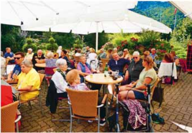
Sommerfest im Altersheim Allmend

voller Erfolg und hat wieder einmal gezeigt, wie wichtig gemeinsame Erlebnisse und fröhliche Momente sind. Für die Organisation über das Dekorieren bis hin zur Vorbereitung des köstlichen Buffets danken wir dem Allmend-Team ganz herzlich. Ausserdem bedanken wir uns beim Duo «Hoggläder» für den musikalischen Beitrag!