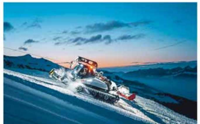
Beim «Pistenfahrzeug mitfahren» gehen Kindheitsträume in Erfüllung!

Hier gehen Kindheitsträume in Erfüllung! Die Mitfahrenden dürfen live miterleben, wie am Pizol die perfekten Pisten für den nächsten Skitag präpariert werden. Nach der rund einstündigen Fahrt erhält der Gast ein Pistenfahrzeug-Pizol-Diplom.