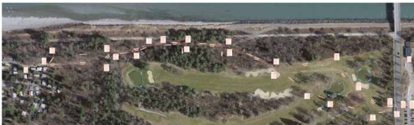
Situationsplan des Leitungsverlaufes