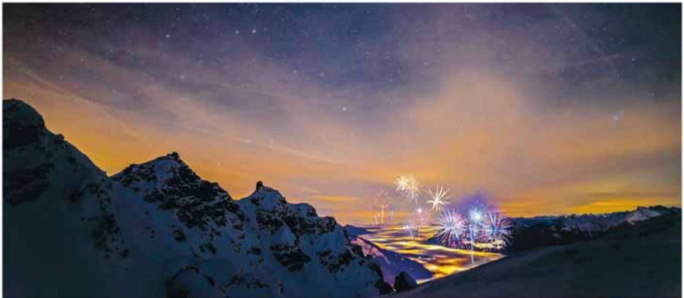
Das Panoramarestaurant Edelweiss und das Berggasthaus Zanuz laden zur Silvesterfeier ein.

Weitere Infos, die Betriebszeiten sowie eine aktuelle Veranstaltungsübersicht finden sich unter: www.pizol.com .