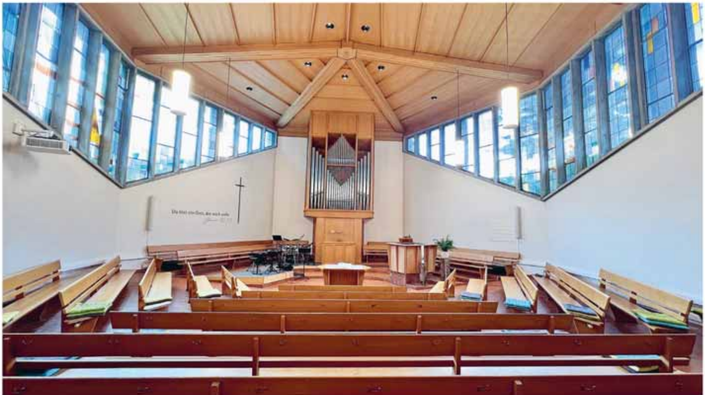
Kirche Sargans innen

Der Gottesdienst in Sargans beginnt um 9.30 Uhr. Von Bad Ragaz aus wird ein Fahrdienst angeboten werden. Wer diesen nutzen möchte, sollte sich bis Freitag, 5. Dezember, 12.00 Uhr, beim Pfarramt melden (Tel. 081 302 71 89, sekretariat@ref-badragaz.ch). In der Ragazer Kirche findet an diesem Sonntag kein Gottesdienst statt.