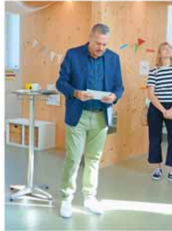
Eindrücke vom Tag der offenen Tür in der Kinderwelt Tamina